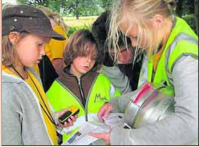
■ De kinderen vinden een nieuwe aanwijzing tijdens de gps-tocht.

H et is weer zomervakantie! Iedereen viert die op z'n eigen manier: de een vertrekt gezellig naar de camping, de ander zweert bij de Zuid-Europese zon. Elk jaar zijn er ook weer vakantietrends te ontdekken. De Telegraaf op Zondag zet ze voor u op een rijtje. Vandaag deel vijf: het kinderkamp.