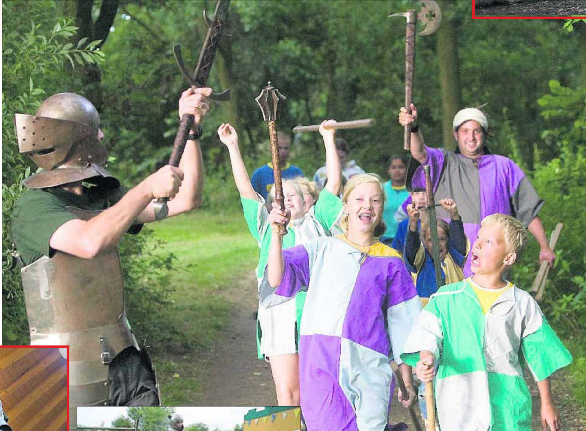
■ Aanvallen!!! De kinderen zijn klaar voor hun demonstratie zwaardvechten aan de ouderen op het kamp.

'Het slaat toch nergens op dat we afspraken maken over het zwaardgevecht?'