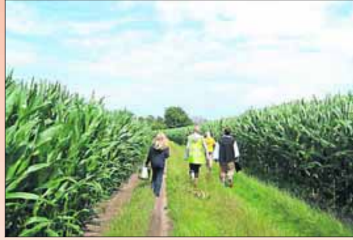
■ Wandelen door de maïsvelden op zoek naar de schat.